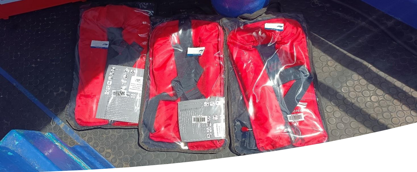
Luces led, asientos y chalecos salvavidas