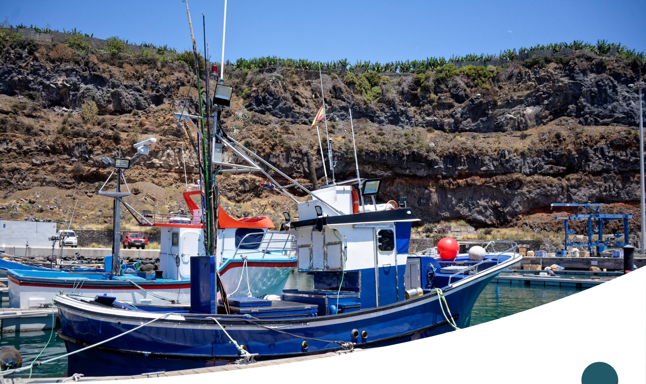
Embarcación "NUEVO PÉREZ"