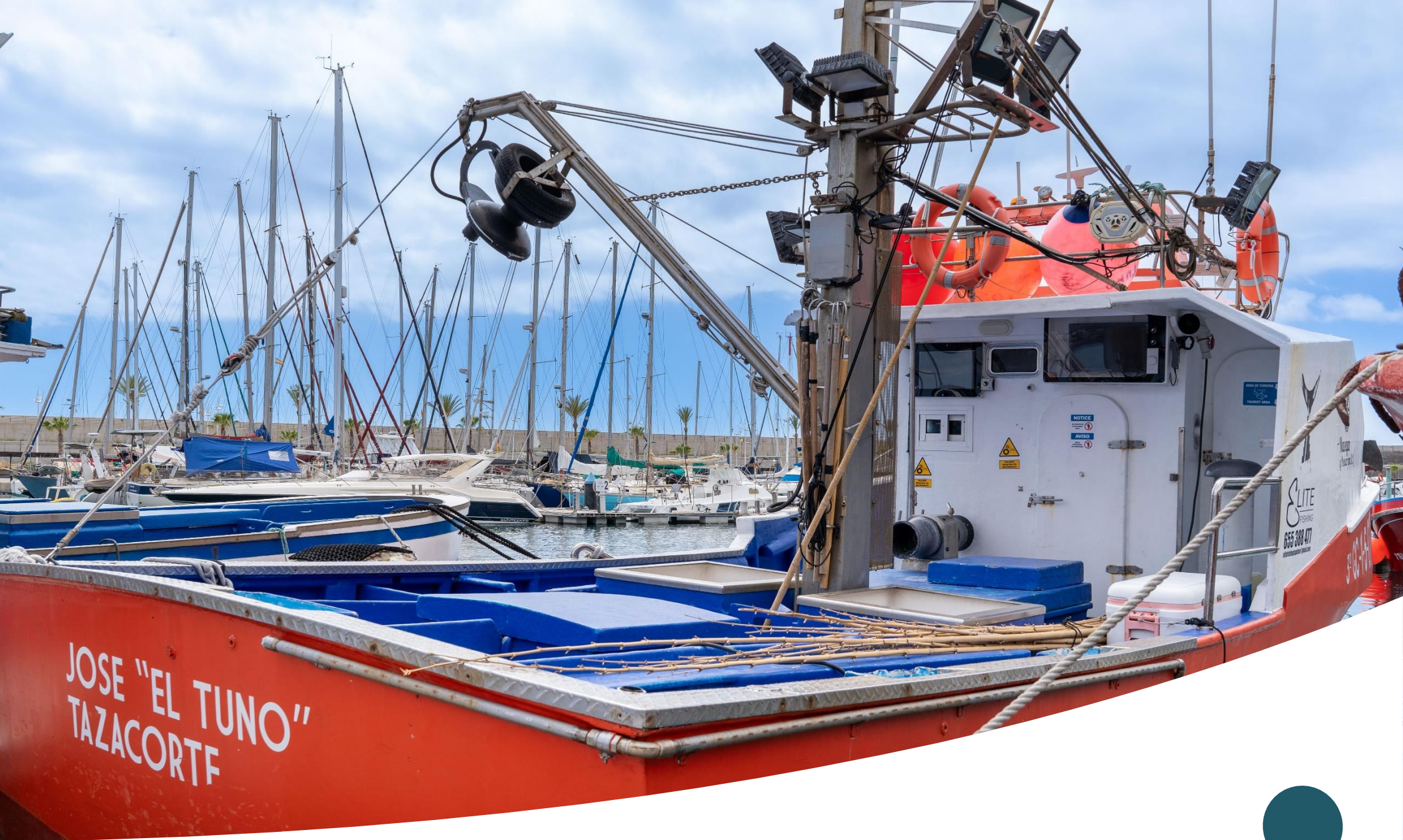
Embarcación "JOSÉ EL TUNO"