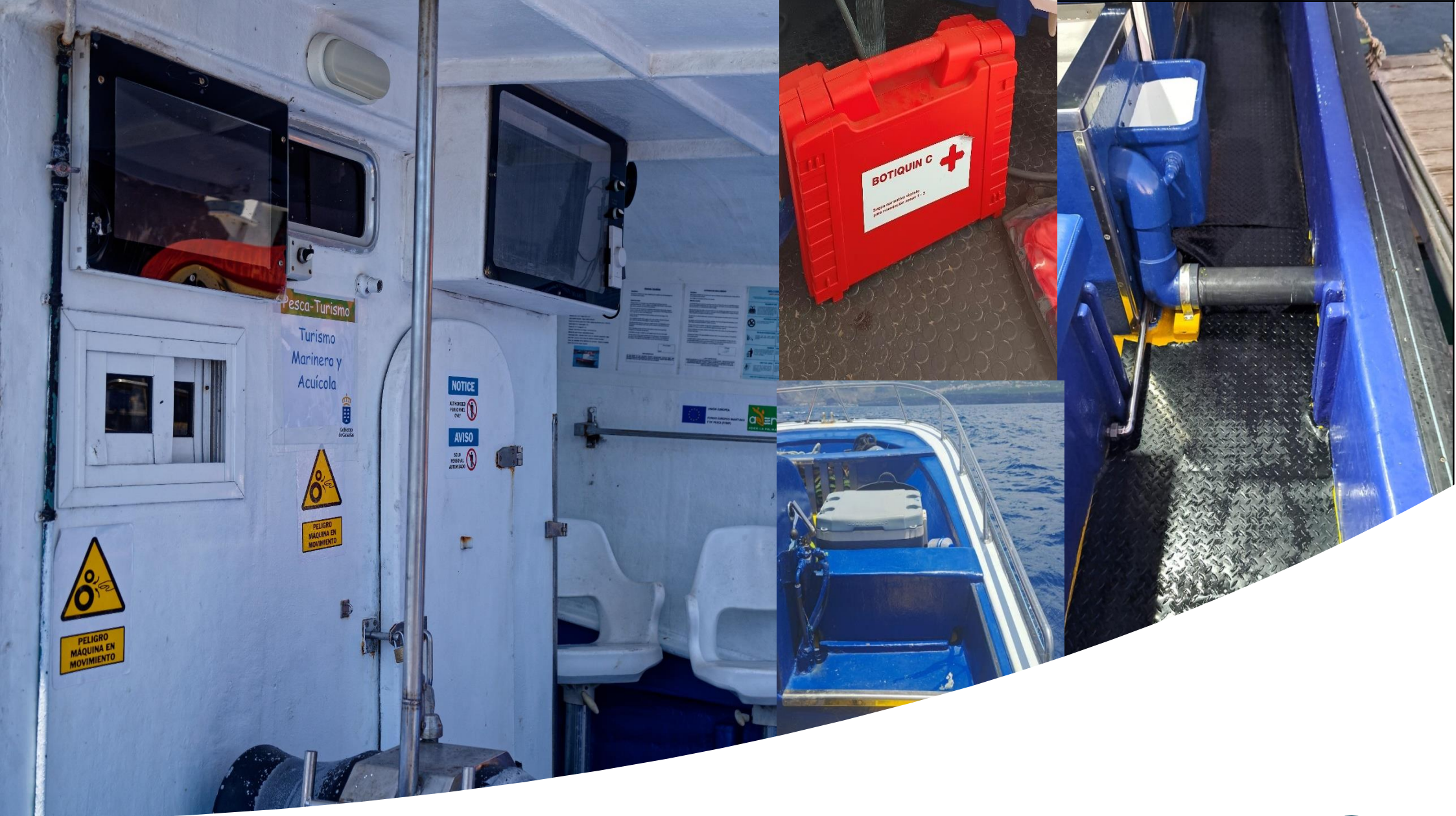
Cartelería, suelo antideslizante, botiquín y agarradero