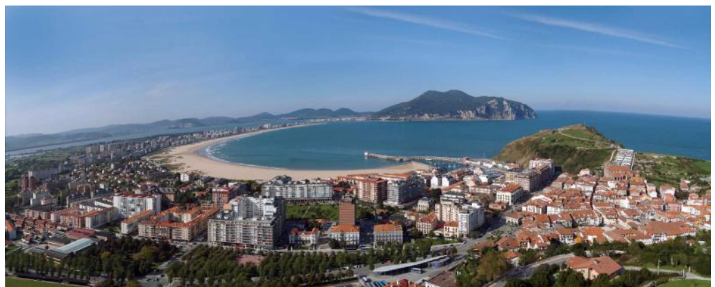
Vistas de Laredo.

“Trasladar a las zonas de pesca y a su población las oportunidades que presenta la implantación de estrategias de desarrollo local participativo, es una