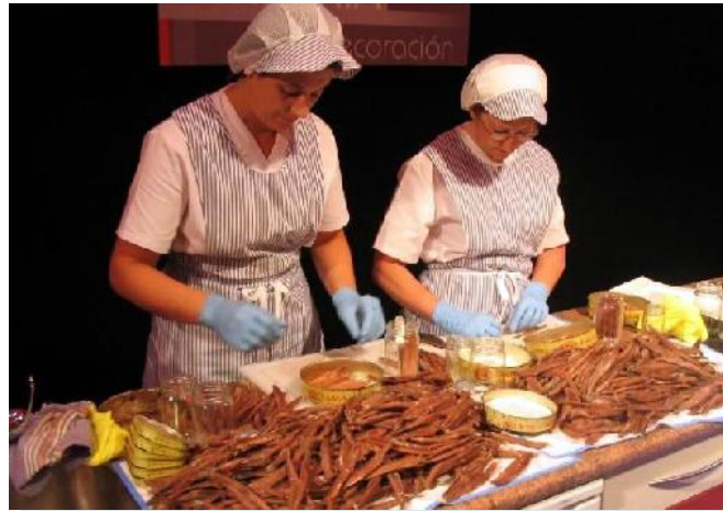
Proceso de la Anchoa

detección de potenciales beneficiarios de actuaciones o proyectos, también