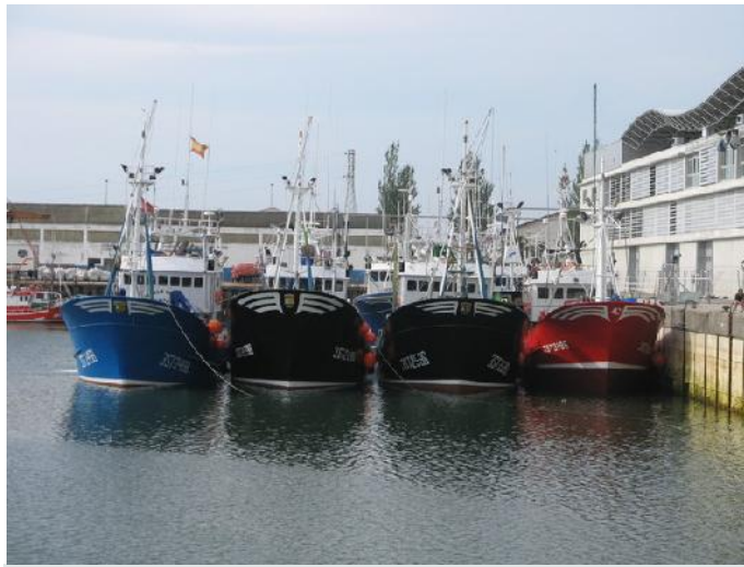
Puerto de Santoña

servar en la Conferencia "Sailing Towards 2020" celebrada en Bruselas en