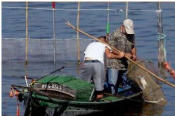
Estudio de la implementación de barcas con motor eléctrico en l'Albufera de València