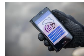
Aplicación móvil para reportar datos de capturas