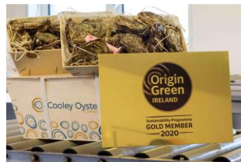
Reducir los residuos ligados a la producción de marisco