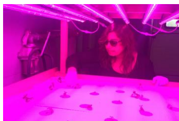
Desarrollo de la cría de acuapónicas en interior