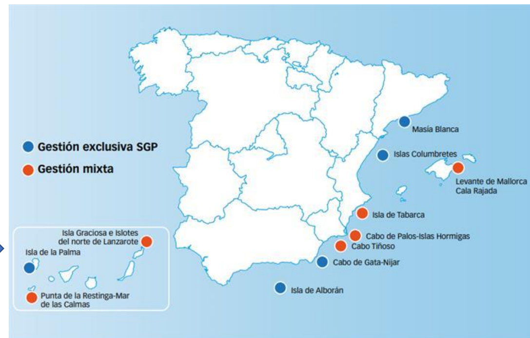
Localización de las 11 reservas marinas gestionadas por la SGP, en régimen de gestión exclusiva o mixta.